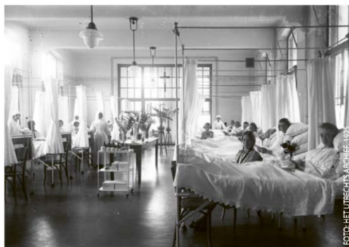
De vrouwenzaal van het voormalige St. Antonius Gasthuis in 1927. Meer historische foto's van het ziekenhuis op www.oostkrant.com/antonius

Leden van de groencommissie bij het honderd jaar oude hekwerk rondom het oude ziekenhuis. Het hek is deze zomer opgeknapt: de pijlers zijn opnieuw opgemetseld, de verbindingen vervangen en al het smeedijzer is gezandstraald en geschilderd. Een heidens karwei gegeven de honderden krullen, punten en andere siervormen.